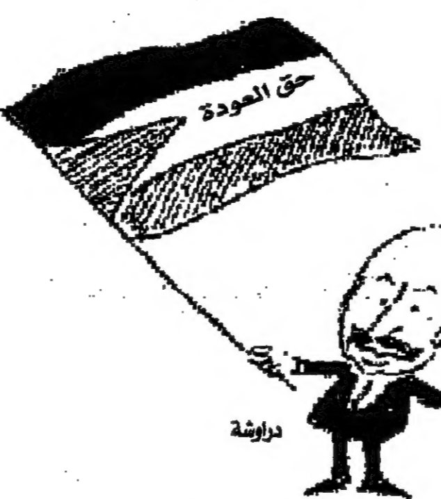
دراوشة (بيروت امير)

قبل عدة ايام توجه وفد كبير من النواب والشخصيات في اوساط عرب إسرائيل الى سورية وقد وافق أعضاء هذا الوفد من الكونغرس الإسرائيلي الذين يشركون مشاركة كاملة في الحياة السياسية لاسرائيل والمطابقين بتحقيق كامل حقوقهم المدنية والدينية والسياسية مع ضمان من ولايتهم للتربية والتعليم على التنازل عن جوازات سفرهم الإسرائيلية والقبول في سورية ببطاقات سفر سورية وقومية وفهم الوفد الفلسطيني او وفد فلسطيني الداخل او وفد فلسطيني 1948